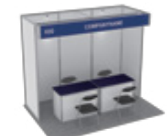
■ 기본 부스 규격 (W:3m x D:2m x H:2.4m)

부스 가격 ※해외 현지 학교, 업체, 기관은 US $금액 적용 (부가세 별도)