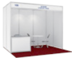
■ 기본 부스 규격 (W:3m x D:3m x H:2.5m)

부스 가격 ※해외 현지 학교, 업체, 기관은 US $금액 적용 (부가세 별도)